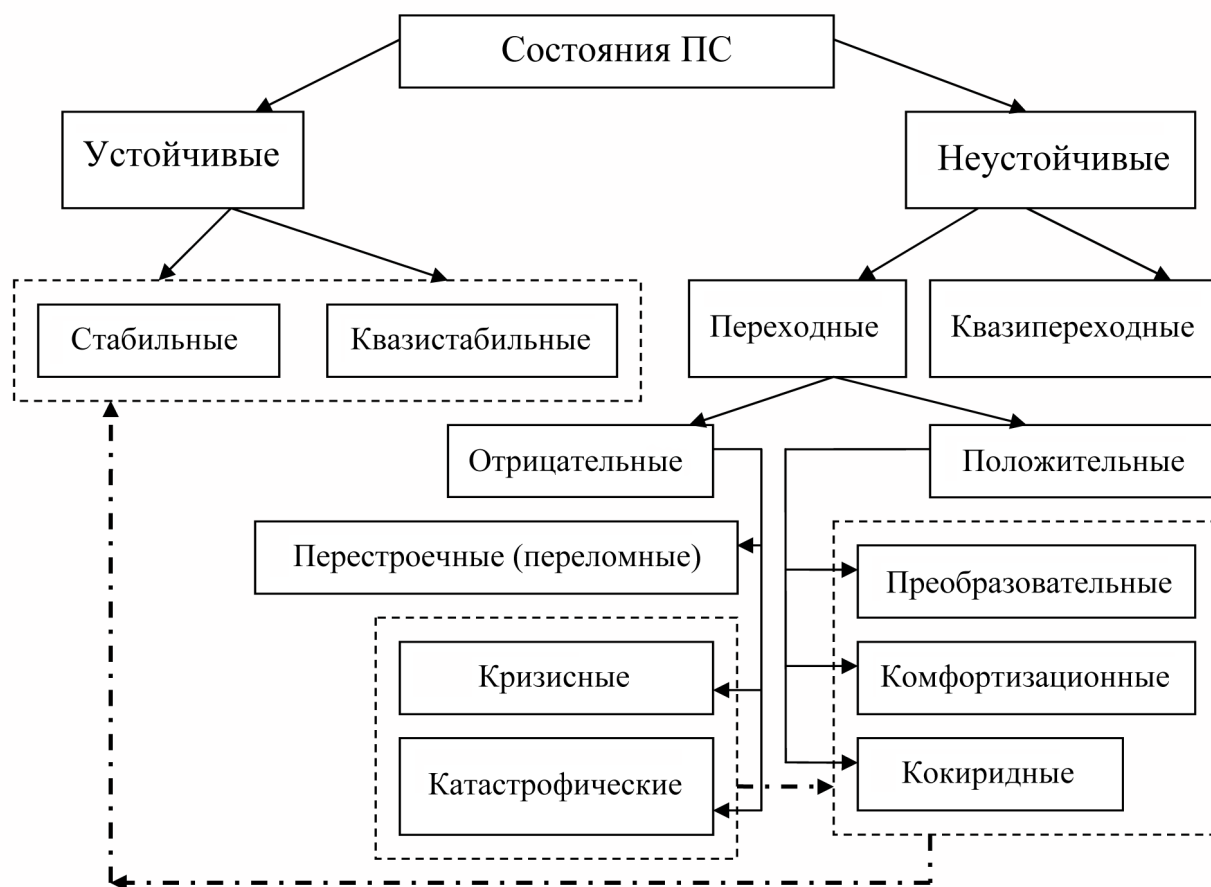
Рис. 1. Состояния ПС и этапы структурной стабилизации

Такая классификация переходных процессов может быть применена и при формировании траектории изменений в производственной системе, ведущих к формированию