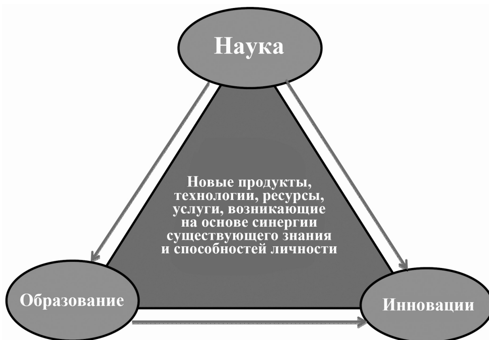
Рис. 1. Структура и результаты интеллектуального потенциала

3. Образование — инновации. Коллаборация между акторами оценивается по таким